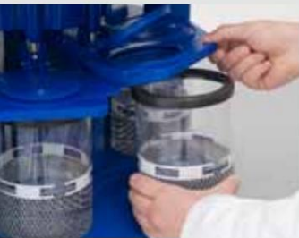
Llenado e inserción de contenedores de medios