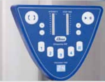
Programa de inicio