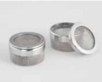
Elmasolvex con accesorios RM

¿Se puede mejorar la tecnología probada?