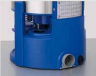
Conexión del aire de escape