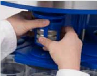
Cesta de inserción con piezasde reloj